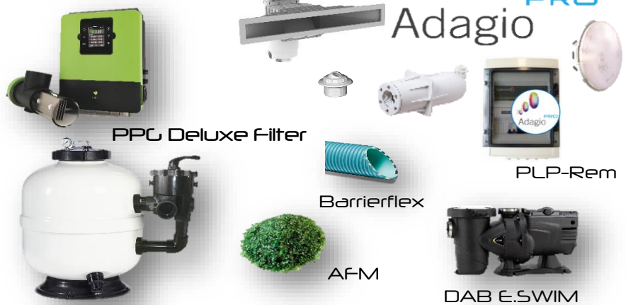
PPG Deluxe Filter